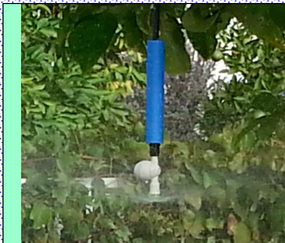
UD 50L/H set in operation